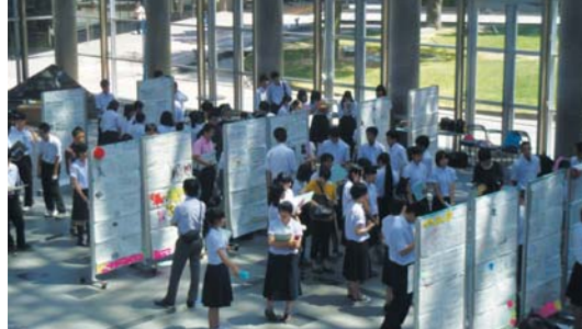
研究の成果はポスターセッションで発表。外部にも広く公開し、講師などから評価を受ける。