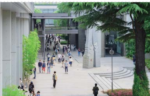
(左上)一般にも無料公開する國學院大學博物館。「考古」「神道」「校史」の3つの常設展と、企画展とが通年で楽しめる。(右上)平安時代の月見の集いを再現した秋の『観月祭』は國學院大學の恒例行事のひとつ。神道文化学部の学生を中心に、雅楽や舞を披露。地域住民や近隣の駐日大使館員らも訪れ、毎年多くの人々で賑わう。(左下)文・神道文化・法・経済の4学部のメインキャンパスである渋谷キャンパス。アクセスもよく、渋谷・表参道・恵比寿の各駅から徒歩13~15分という立地だ。2015年春には「國學院科目」を中心に開講するための和室教室を新設した。

グローバルな時代だからこそ、より注目が集まるのが日本の文化・伝統の研究である。創立以来135年にわたり「日本を学ぶ」教育を実践してきた國學院大學。現在、同学で進む教育改革について、赤井益久学長に伺った。