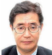
内閣官房まち・ひと・しごと創生本部事務局