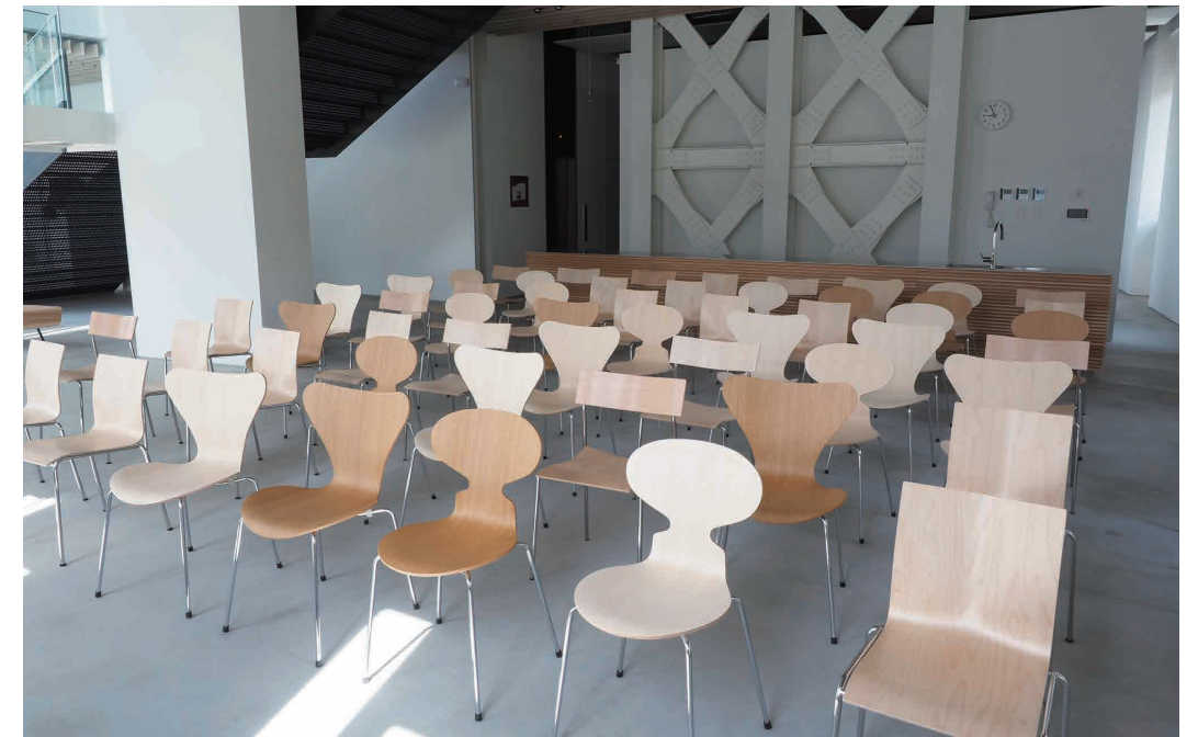
「デザインスタジオ」で作成した設計案を発表する「講評室」。壁のないオープンスペースで、通りがかった人が誰でも聴衆になれる。