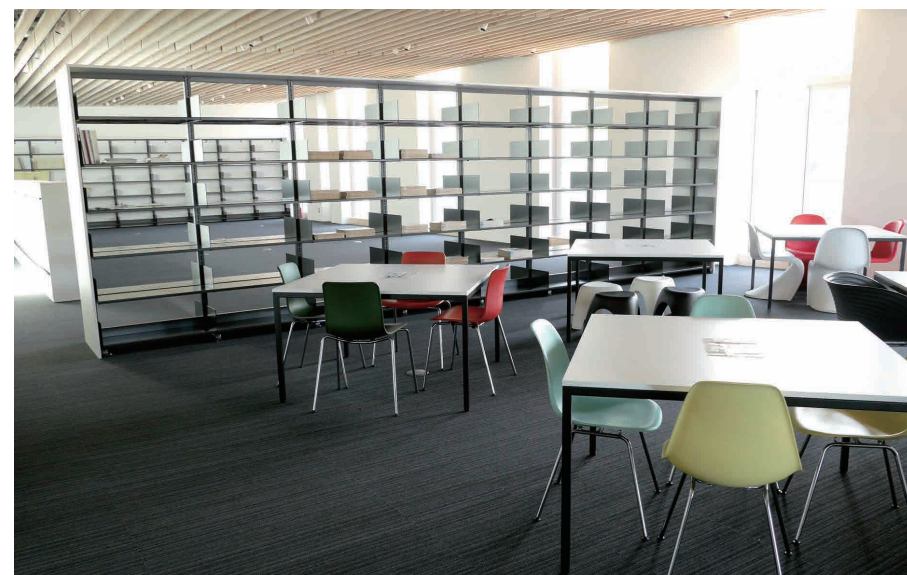
オープンカウンターの給湯室や、デザイナーズチェアに座れるスペースなど、交流空間を建物内に多く配置した。勉強だけでなく、ゼミの打ち上げや一人になれる多様な選択肢のある居場所を作ることで、オンとオフの過ごし方にも配慮した。