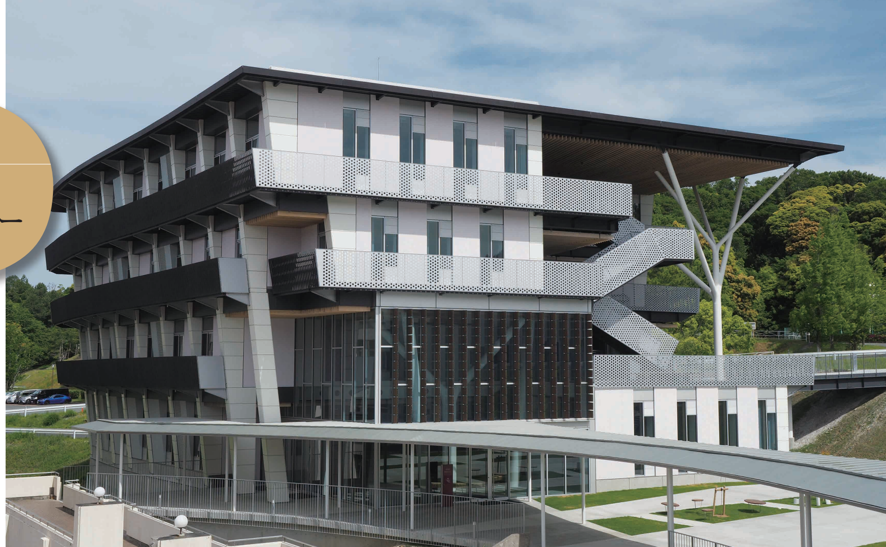
柱を外側に傾斜させ、上階ほど床面積が大きい構成とし、さらに曲面壁が覆う。

鉄板の素材感を感じる黒皮仕上げのエントランス階段と、大きな軒下を支える「樹状柱」。滑らかな木の曲線を再現するために、鋳物とパイプを溶接し、耐火塗料をコテで仕上げている。難易度の高い日本の技術が凝縮されている。