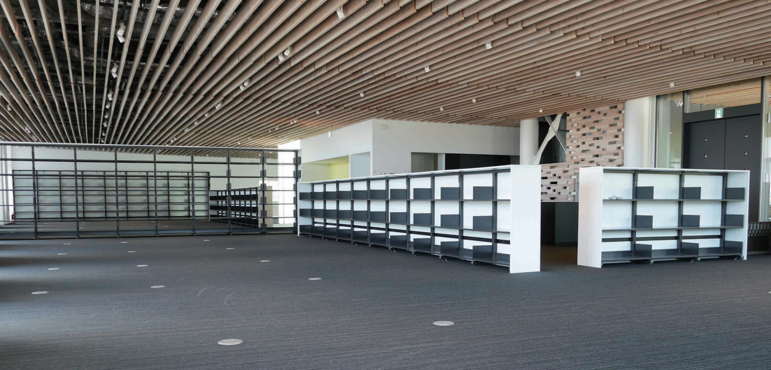
研究室も他の分野と一室空間の「ミックスラボ」とし、分野融合の新しい研究が生まれることを期待した。

静岡理科大学は、静岡県で初の建築学科を2017年4月に新設。その校舎となる建築学科棟「えんつりー」を2月に竣工した。「えんつりー」とは、建物の意匠的な特徴である「樹木」と、学生が入学し、社会にはばたく言葉「entry」を組み合わせたものだ。