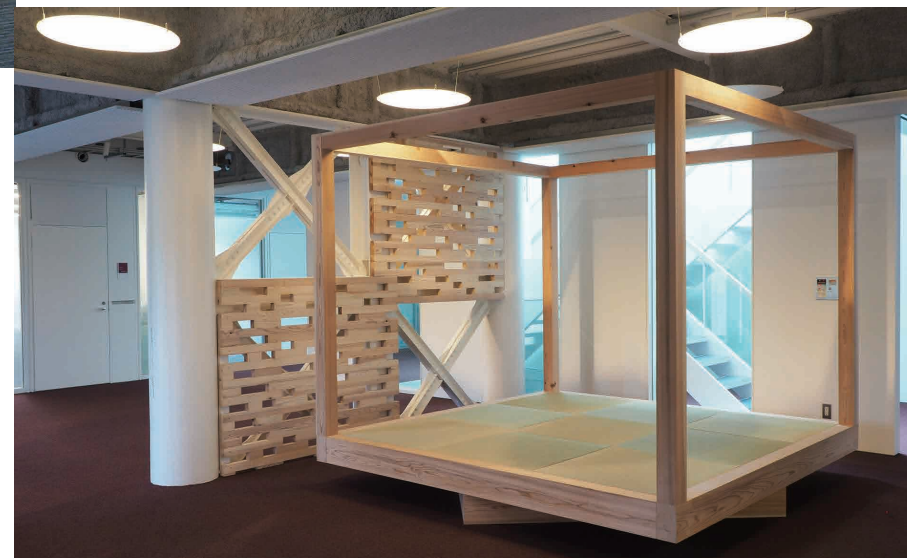
4畳半の畳空間は、日本の住宅に用いる尺モジュールの900グリットを体感できる教材も兼ねる。学生は予想以上に居心地の良さを感じている様子。