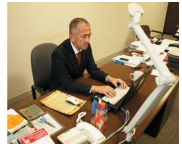
簡単な写真と簡単な文章。校長が自ら投稿するほか、一般の教員も管理職のチェックはなしでタイムリーに記事を上げる。それが長続きのコツ。