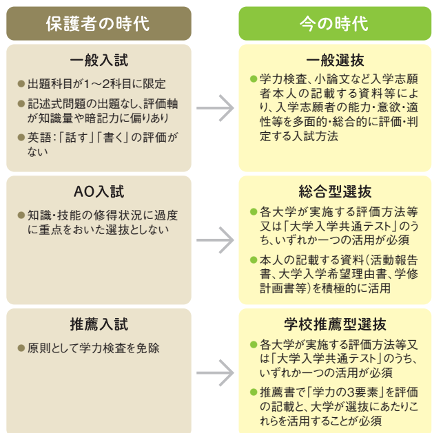
図2 大学入学者選抜の入試区分の変化