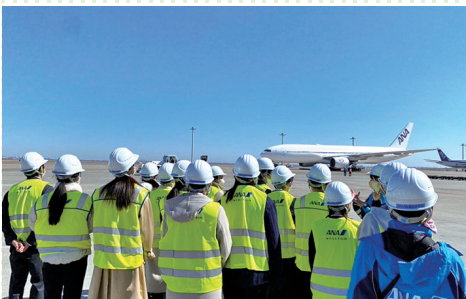
(左上) 学内のキャリアサポート課には、毎年秋になると「内定者アドバイザー」が日替わりで常駐。IT・金融・商社といった人気業界を中心に内定を得た4年生約30名が、自身の体験をもとに学生目線のアドバイスなどを行っている。 (右上) 主に2年生を対象に行われた12月の「就職ガイダンス」。2年という早い段階での開催にもかかわらず、熱心に耳を傾ける学生が多く、就職活動の早期化は学生自身も実感しているようだ。 (左下) 「現場見学会」では、普段は目にするのできない現場の内部やバックヤードなどの見学を通じて、仕事への理解を深めていく。