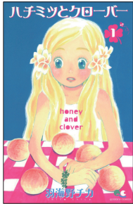
ハチミツとクローバー 羽海野チカ／集英社刊

本書で触れた「探究」の入り口は、案外、生活の半径5mに隠れているのかもしれませんが。多くの取材を通して思うのは、立派なテーマなどなくていいということ。ふと漏らす「これ何？」という小さな声を、ぜひ一緒に面白がってみてください。その好奇心が正解のない時代の羅針盤になり、やがて「進路」そのものになる。そんな時代なのかもしれません。(赤土)