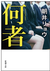
何者 朝井リョウ／新潮文庫刊

『変化の大きい時代にわが子はどう生きる?』というタイトルは、これから社会に出る高校生だけでなく、今の社会に生きる私にも関わっている気がしました。変化することには怖さもあるけど、どうせなら楽しみながら波に乗っていきたいです。担当した企画『思春期の子に寄り添うヒント』の中の「人生を楽しむ姿勢を大人が示したい」というメッセージが心に響きました。(赤羽)