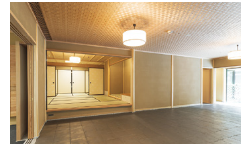
茶室(公徳庵)：日本の文化や精神に触れ、「公徳心を体した真の国際人」の素養を磨く。