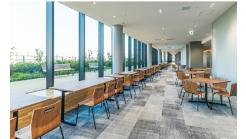
8F ラウンジ：池袋の街を一望でき、外にはテラスを設置。自習や交流の場としてくつろげるラウンジ。