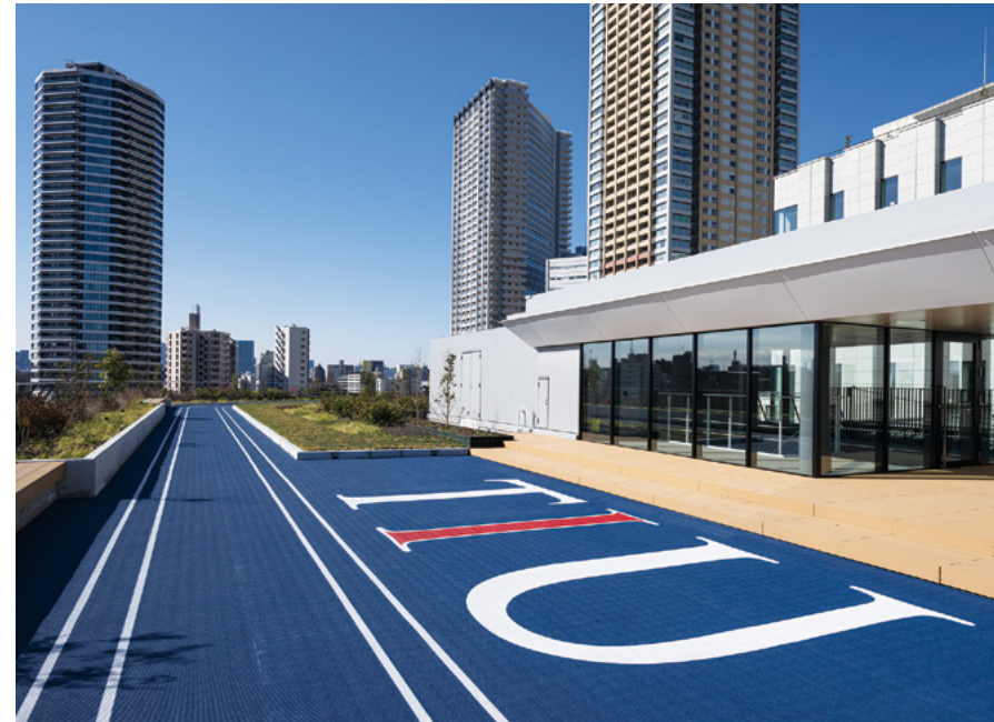
天空のランニングコース：眼下には防災公園が広がる屋上ランニングコース。トレーニングジム、フィットネススタジオを併設。