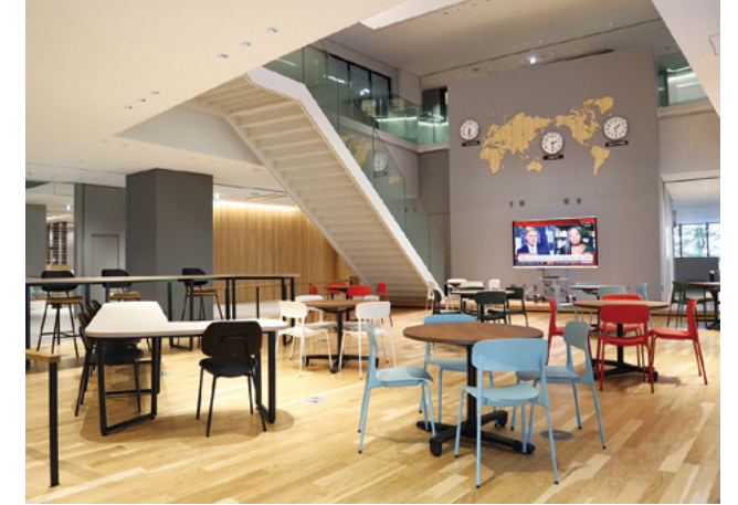
TIU COMMONS (Global Commons)：各種ワークショップや多言語イベントを開催。日常的に英語や異文化に触れられる交流エリア。