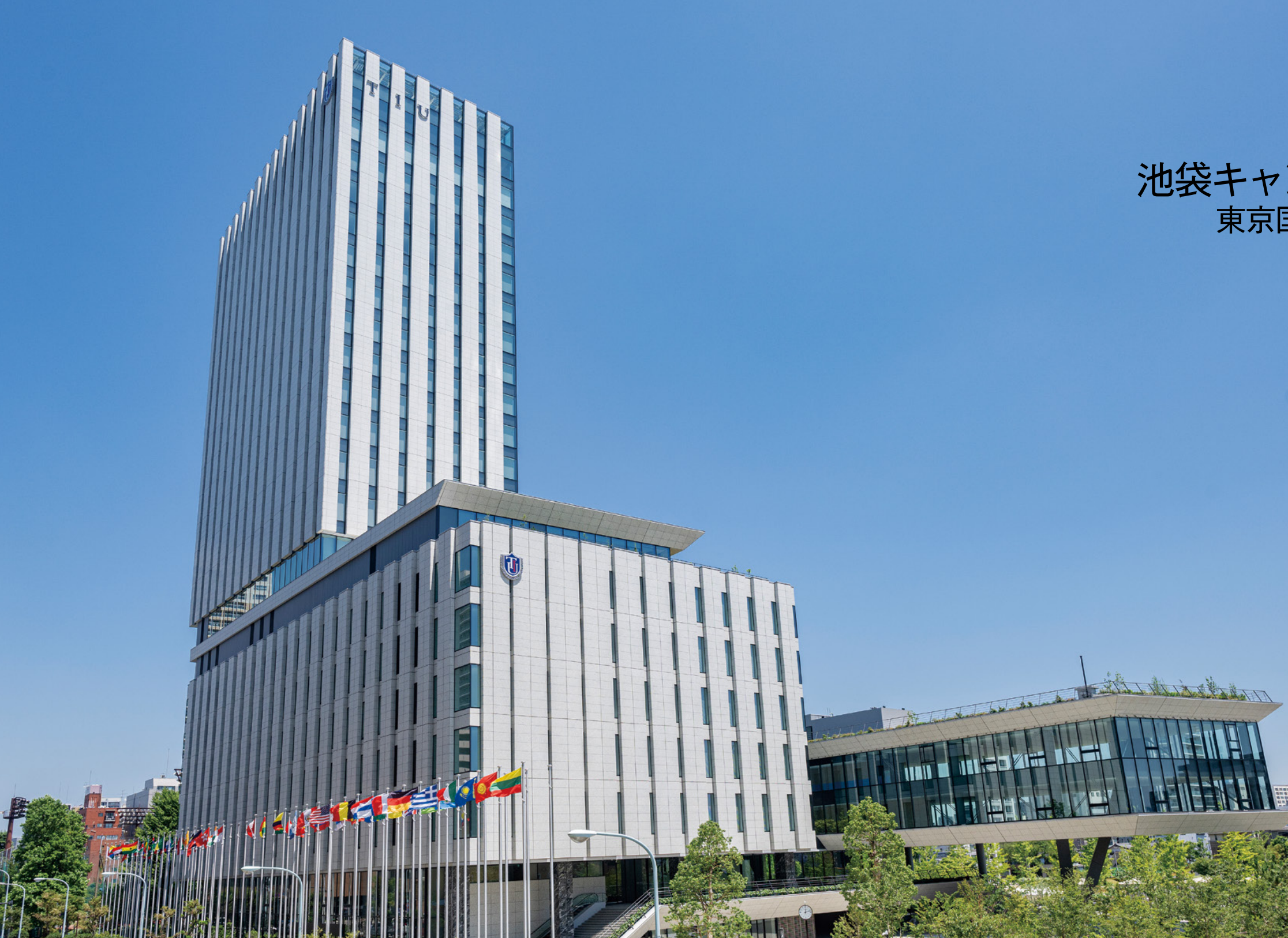
新校舎沿いには、留学生の母国の国旗を掲揚。