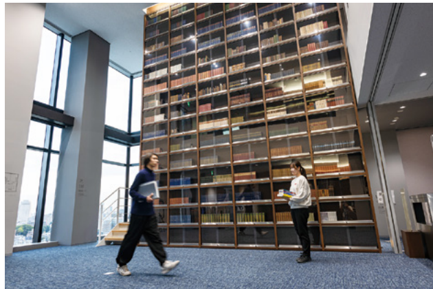
図書館：インターナショナルタワーの10階、11階に設置。エントランスには知の承継を象徴するブックウォールがそびえる。