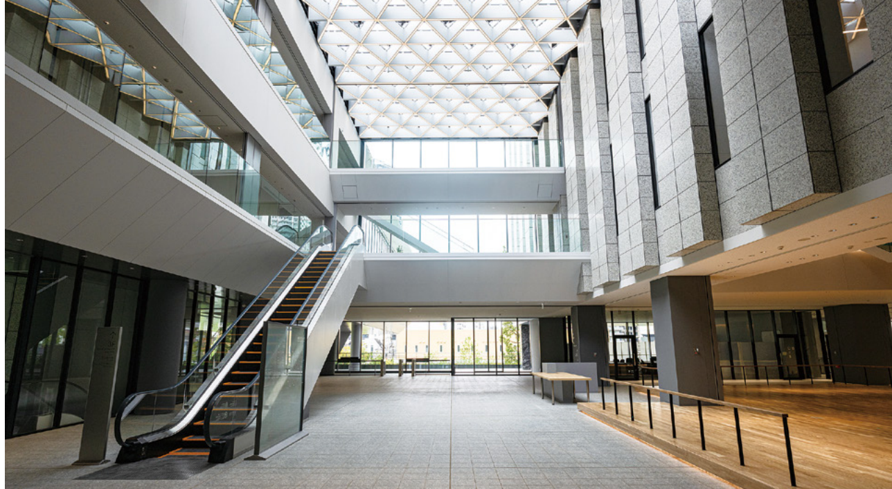
アトリウム：インターナショナルタワーとガーデンウィングをつなぎ、天井からは光が降り注ぐ明るく開放的な空間。