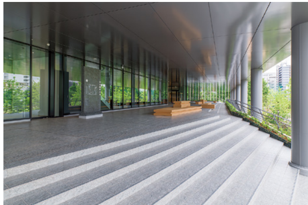
インターナショナルデッキ：防災公園に面し、四方の屋外階段からアクセスが可能な交流エリア。