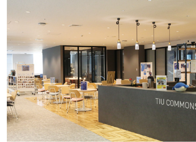
TIU COMMONS (Learning Commons)：ネイティブ教員との英会話を楽しめる English Lounge や Academic Advisingなどを整備。