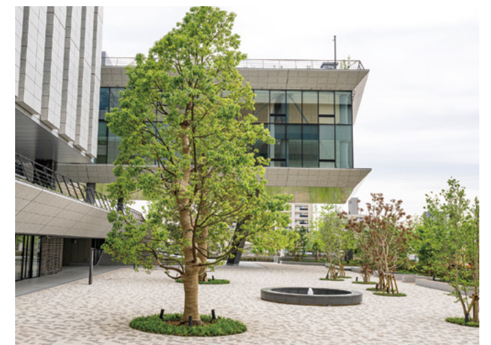
哲学の杜：噴水が設置された緑広がるエリア。