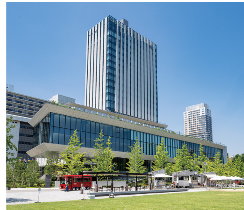
目の前には、豊島区最大の防災公園(IKE・SUNPARK)が広がる。