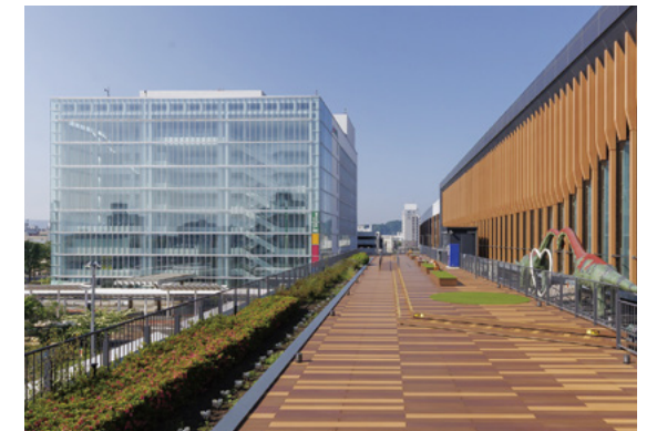
地域政策学部が2年次より学ぶ「福井まちなかキャンパス」（写真左奥）。福井駅（写真右）に隣接する、地域に関わりやすい立地で学ぶ。

2025年4月に入学した恐竜学部の1期生の入試では、総合型選抜（定員6名）に63名、（志願倍率10.5倍）、一般選抜前期日程（同15名）に109名（同7.3倍）、後期日程（同3名）に82名（同27.3倍）が出願。続く2026年4月入学者の総合型選抜の志願倍率も10倍を超える等、「全国から