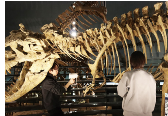
恐竜学部の科目「デジタル古生物学概論」の授業イメージ。恐竜骨格を3Dスキャンし、デジタルデータ化する。

こうした観点から、「恐竜学部に関しては、恐竜という福井の資源を最大限に生かして全国に打って出る学部として、『恐竜を学ぶ』だけでなく、『恐竜で学ぶ』をキーワードにカリキュラムを設計。海外の著名な大学・研究所から客員教授を招聘し、グローバル感覚も醸成します」と岩崎氏