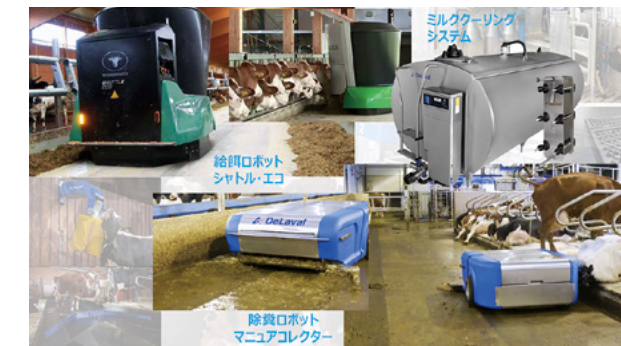
搾乳、給餌、除糞において、AIやICTを駆使した最先端技術を導入。省力化と効率化を図るとともに、学生に未来型酪農を実践的に学べる教育環境を整備。

です」。高度化する農業機械やシステムを現場で扱える、農業の知識とテクノロジーのスキルの両方を兼ね備えた人材へのニーズは、業界全体で高まっていると言えるだろう。