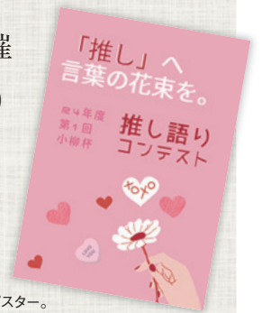
コンテスト告知ポスター。

表現することに自信をもたせるため、年3回実施している図書館主催コンテストのテーマの一つ。「やばい」「○○しか勝たん」などありきたりの言葉を使わずに、自分の言葉で「推し」を称える文章を作成し、競う。題材はアイドルやアニメ、食べ物など何でもOK。国語や英語の教員と連携し、授業のなかで取り組むこともある。