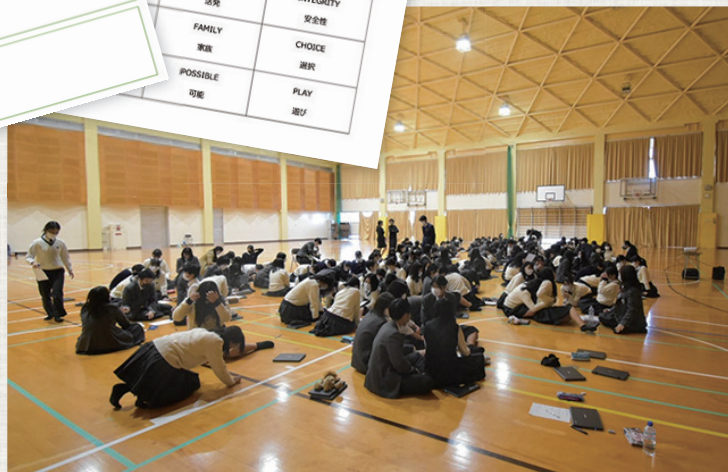
個人ワークと他者との共有を交互に繰り返しながら進行。

ダウンロード可 ※ダウンロードサイト: リクルート進学総研 >> 刊行物 >> キャリアガイダンス (Vol.448)