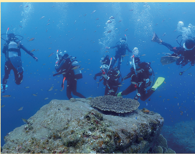
ラムサール条約に登録された世界最北の大サンゴ群生域にて、ダイビングを体験する生徒たち(学校設定科目「マリンスポーツ」)。

具体的には、地域協議会が商工会、行政、地域の事業者・住民などに対して高校の教育活動への支援や協力を依頼し、地域まるごとキャンパス構想に基づく学校設定科目（紀伊半島探究、南紀食文化探究、ジオパーク学、水産生物探究、マリンスポーツなど）の特別非常勤講師を務めていただきました。例えば、地元のダイビング協会の方に協力していただき、学校のプールで実習をしたうえで実際に海に潜ってライセンスをとる…ということもやりました。力を貸してくださった方の人数は、2018年度にはのべ300人近くに上り、こう